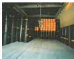
Eliminación en enterramiento profundo de residuos radiactivos (El Cibril, Granada)