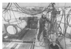
Los lavaderos de sistemas suelen reutilizar los restos de algunas Cisternas para lavar otras

La normativa española ha recogido los criterios comunitarios en la Ley 10 / 1998: